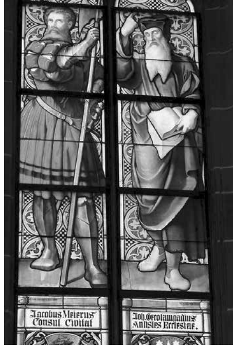
Dr Jakob Meyer zum Hirzen mit syner Helebarde und dr Reformator Johannes Oekolompad uff ere Glasschybe im Basler Minschter.