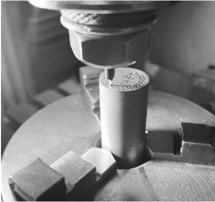
D'Graviermaschine vo dr Firma Müller

zaponiert, das haisst mit eme farblose Lagg d'Oberflechevereedlig abgchlosse. Es isch sehr vyl Handarbet derby und jeedes edle Stygg wird zigmool ainzeln in d'Händ vom ene zueverlässige Mitarbeiter vo dr Edelbläch-Manufaktur Müller gnoo. Vo dr Greenig vom Kinschtler bis zer Blaggedde-Vernissage isch allerhegschti Diskretion aagsait.