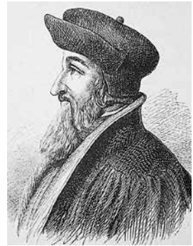
Johannes Oekolampad, dr Reformator vo Basel, 1482 - 1531.