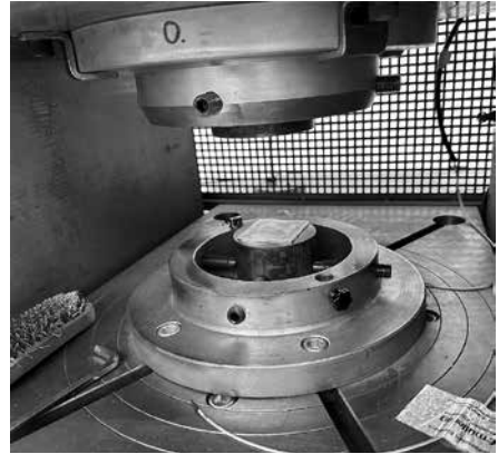
D'Prägemaschine vo dr Firma Müller