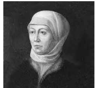
D'Wibrandis Rosenblatt isch d'Wittfrau vom ene Lehrer und drey Reformatore, 1504-1564.