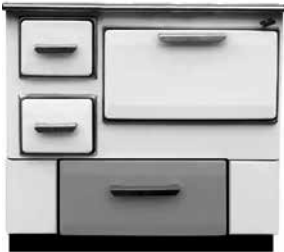
Unseren alte Härd mit eme Zwischeneefeli z'underscht.

Bi den alte Kochhärd – au in unsererer Kuchi isch so aine gstande – het me verschiideni Meegligkaite gha. Uff dr Syte het me kenne im ene Bhälter, glychzytig mit em Koche, Warmwasser baarat mache. E bsunders kummli Yrichtig isch aber 's Zwischeneefeli z'underscht im Härd gsii. In däm bsundere Fach het me kenne 's kochten Ässe warm bhalte. Das isch so quasi dr Vorgänger vom hittige Mikrowällehärd, aber niemer meh kennt das alte Wort, wo my Mamme no allewyl bruucht het.