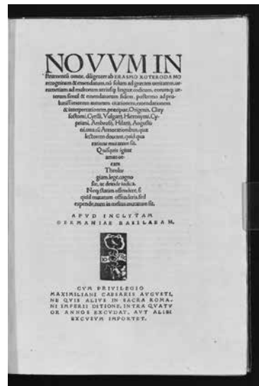
Die erschti Syte vom Novum Instrumentum vom 1. Merz 1516 us dr Druggerey vom Johannes Froben.

Bsunders nooch stehn em Erasmus in Basel dr Johannes Froben, dr Johannes Oekolampad (dr speeteri Reformator vo Basel), dr Bonifacius Amerbach, dr Beatus Rhenanus, dr Ludwig Bär, dr Konrad Pelikan und dr Simon