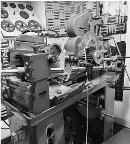
D'Fräsmaschine vo dr Firma Müller

Wie scho im letschte Glaibasler erwähnt, empfihl y jetz scho, verspricht eyre wunderbare Zimmerlinde e Bijou und paillet alli Familienmitglieder, Frind, Kamerade, Noochberen und Gschäftskollegen aa. Machet au no zimftig Wärbig fir d'Blaggedde 2024.