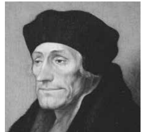
Erasmus von Rotterdam

Dr Erasmus von Rotterdam – är isch Humanischt, Theolog, Prieschter, Augushtiner-Chorheer und Autor gsii – het um 1505 in Italie gläbbt, gschriibe, studiert und isch under anderem dr Lehrer vo de Kinder vom schottische Keenig gsii. Won er uff em Wägg